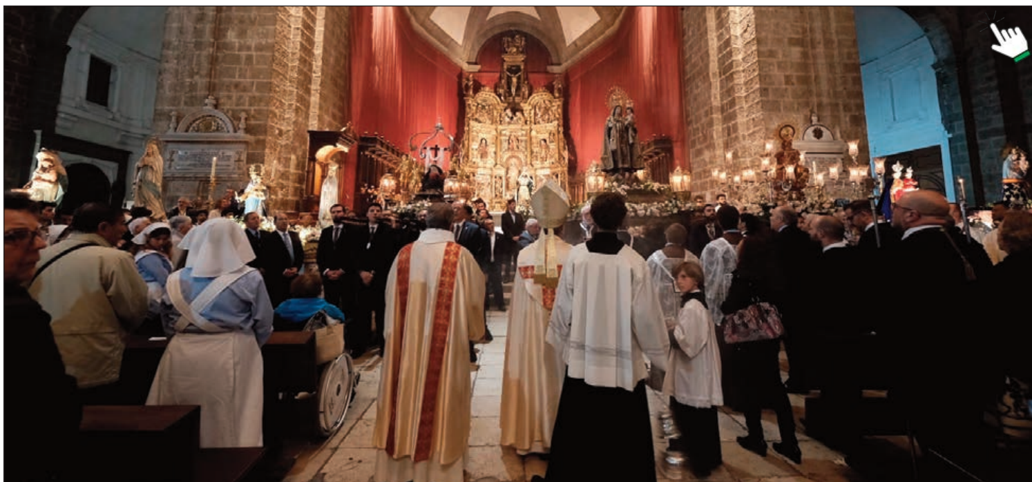
Acto celebrado en el interior de la Catedral con las nueve vírgenes que iban a participar en la Procesión Magna

La lluvia impidió que la Procesión Magna saliera a la calle, pero no que los fieles llegados desde distintos puntos de la Archidiócesis de Valladolid vivieran con desbordante emoción y devoción esta jornada mariana