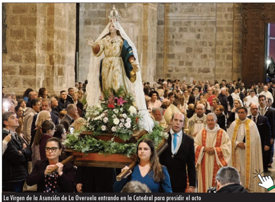
La Virgen de la Asunción de La Overuela entrando en la Catedral para presidir el acto