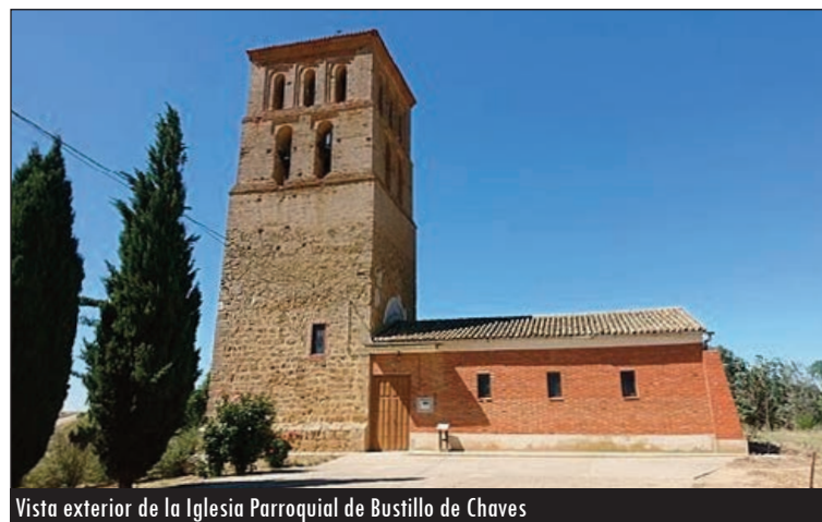
Vista exterior de la Iglesia Parroquial de Bustillo de Chaves

Allí, la recuperada torre de cuatro cuerpos es el mejor vestigio de la ya desaparecida Iglesia Parroquial El Salvador, que se mudó a pocos metros, a una nueva capilla que mantiene la misma advocación y donde se con-