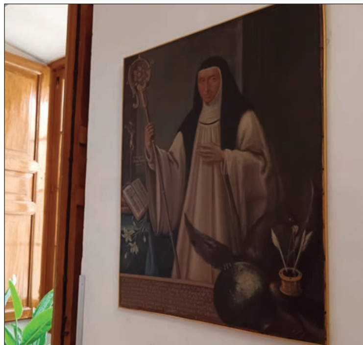
Cuadro conservado en el Monasterio de San Joaquín y Santa Ana de Valladolid

También en el Monasterio de San Joaquín y Santa Ana de Valladolid rezan ya “para que lo reconozcan y siga el proceso adelante”, desea la