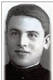
Beato Melecio Pardo