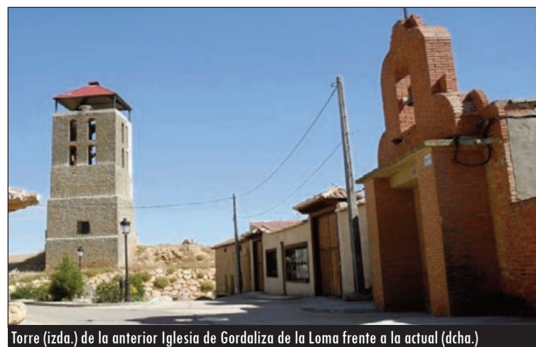
Torre (izda.) de la anterior Iglesia de Gordaliza de la Loma frente a la actual (dcha.)

conservan esculturas del siglo XVIII, como la de su titular, El Salvador, un Cristo crucificado o un San Antonio de Padua, así como una Cruz parroquial de plata del primer tercio del siglo XVI.