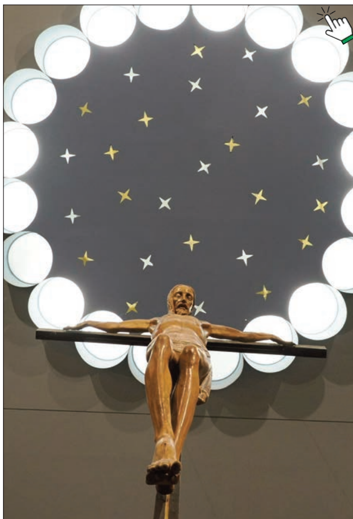
Detalle de la Iglesia del Colegio La Anunciata de Valladolid, tras las obras de reforma

diversas advocaciones marianas reunidas para celebrar la Eucaristía con la pretensión de procesionar por las calles y plazas de nuestra ciudad, se celebraba, casi a la misma hora, un concierto de Hakuna. También podríamos decir una expresión de la religiosidad popular en esta hora de cultura pop, que se hace música, que se hace asamblea, que canta y danza, queriendo también así manifestar un sentimiento religioso con las formas de la música contemporánea.