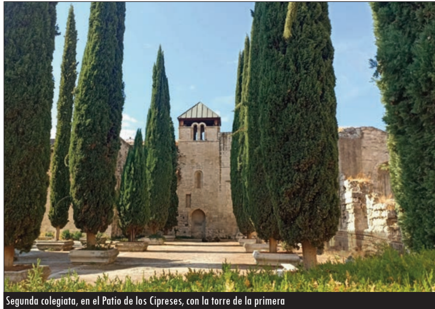
Segunda colegiata, en el Patio de los Cipreses, con la torre de la primera

La mencionada yuxtaposición que se realizó sobre la primera Colegiata provocó su destrucción, aunque en 1228 la nueva ya se podría encontrar disponible. Entonces se celebró un nuevo concilio nacional. Esta "segunda" Colegiata es