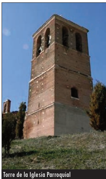
Torre de la Iglesia Parroquial

Esta Iglesia tuvo tres etapas en su construcción: la primitiva fue mudéjar, correspondiente al tercer cuarto del siglo XIII; una segunda etapa fue la del