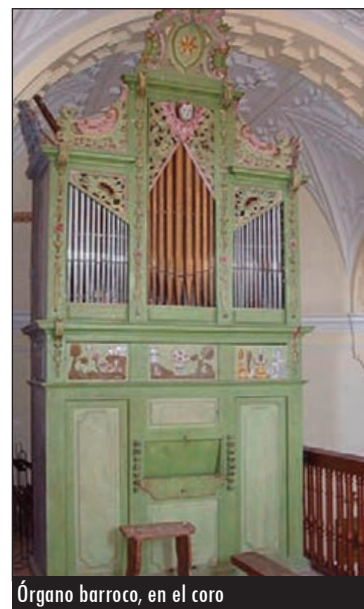
Órgano barroco, en el coro

La Iglesia se levanta sobre un pequeño cerro dentro del pueblo y cuenta también, con una destacada cabecera absidial semicircular. De la primera obra mudéjar sólo se conserva el ábside y el tramo recto del presbiterio. Este ábside únicamente es visible desde el exterior y parcialmente, debido a que la torre se encuentra adosada a su parte central. Dicha obra mudéjar tiene cuatro series superpuestas de arcos doblados y ligeramente apuntados.