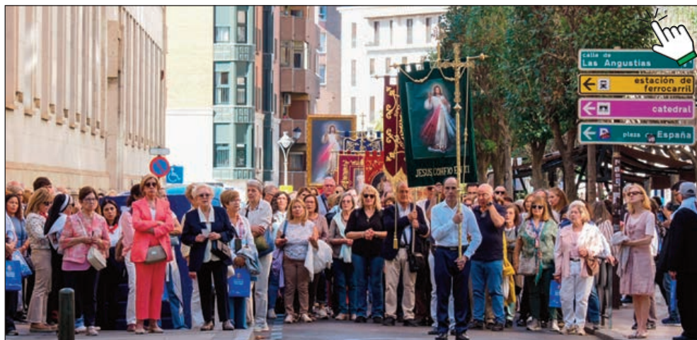
Los devotos de la Divina Misericordia, en via crucis procesional de camino a la Basílica—Santuario Nacional de la Gran Promesa, donde se celebró los días 4 y 5 de octubre el XVII Encuentro Nacional con más de 200 participantes

E l Santuario Nacional de La Gran Promesa fue inaugurado en el año 1941 y el 12 de mayo de 1964 el Papa Pablo VI concedió al templo el título de Basílica menor. El Centro Diocesano de Espiritualidad (CDE) se constituyó el 28 de septiembre de 1994 como un lugar de acogida, descanso, oración y formación, donde encontrarse con Dios, con uno mismo, con los demás. Ambos son lugares de paz en el corazón de Valladolid.