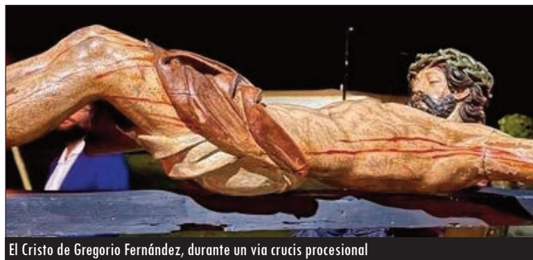
El Cristo de Gregorio Fernández, durante un via crucis procesional

Una muestra de la calidad escultórica castellana, donde su autor, Gregorio Fernández, convierte o vuelve a convertir la madera en carne debido a su perfección anatómica y detallismo. Una escultura que fue trasladada en 1803 desde Valladolid a Brahojos de Medina, donde llegó para ser la bella joya de su Iglesia Parroquial, así como el orgullo de sus vecinos.