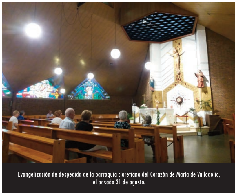
Evangelización de despedida de la parroquia claretiana del Corazón de María de Valladolid, el pasado 31 de agosto.

Habría muchas más cosas que decir, pero quizá el último compromiso sería el de la formación de los adultos, la catequesis familiar, etc. todas estas mediaciones que la Iglesia puede ofrecer para el crecimiento integral de sus hijos.