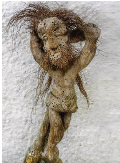
Santo Cristo de la Cepa

Tras la aparición milagrosa y la conversión del "incrédulo", había que plasmar ésta a través del bautizo del judío de manos del arzobispo de Toledo, diócesis ésta que no era solamente de la que procedía supuestamente y en origen esta extraña imagen sino que también era la titular y propia del prelado donante que se lo entregó a los monjes vallisoletanos de San Benito. Podía ser éste uno de los mecenas más antiguos y generosos de la casa central de la llamada Congregación benedictina de Valladolid. Nos referimos al arzobispo de Toledo, el