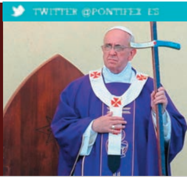
TWITTER @PONTIFEX ES