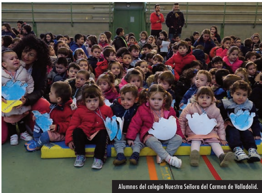
Alumnos del colegio Nuestra Señora del Carmen de Valladolid.

aquel año leer la obra de su contemporáneo Tomás Moro, su novelita titulada 'La Utopía', de 1516, en la que describía una isla soñada como llena de paz y orden, donde todo sale bien y donde cada uno goza con todo lo que le rodea con mirada serena y agradable.