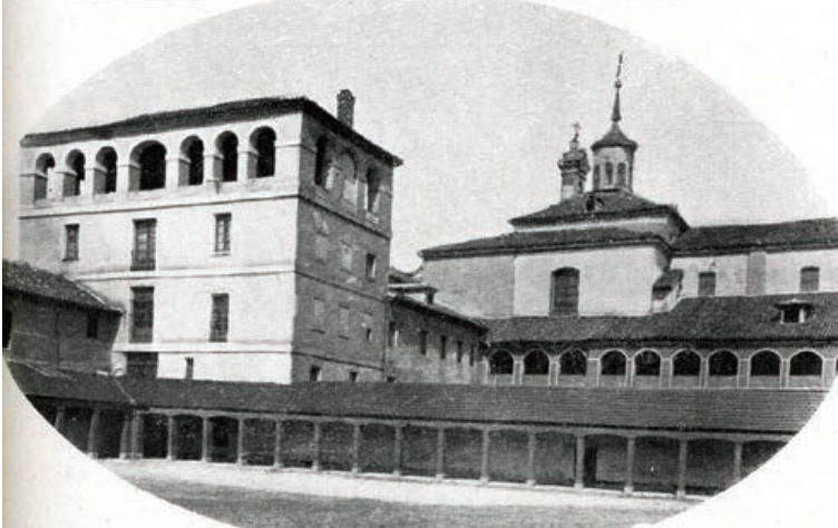
Antiguo colegio de San Ambrosio de la Compañía, donde se estableció, en 1771, el Colegio de los Escoceses.