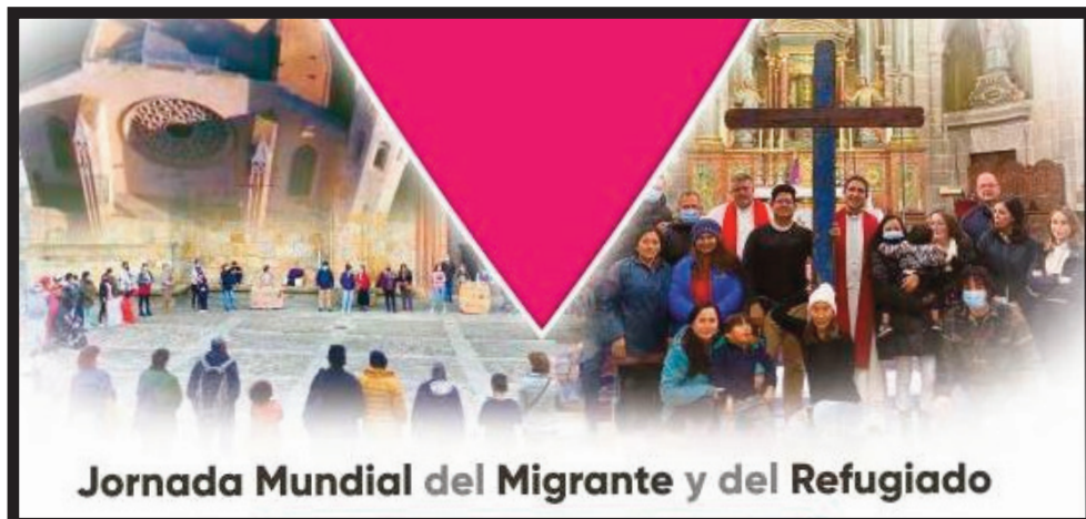
Jornada Mundial del Migrante y del Refugiado