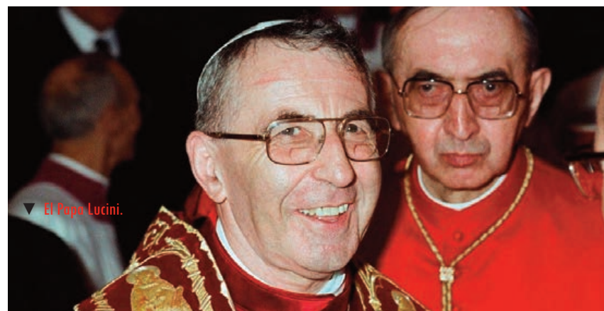
▼ El Papa Lucini.

Su proceso de beatificación ha sido largo: duró 44 años pero su elevación a los altares ha sido acogida sin polémicas y con un general reconocimiento de sus virtudes.