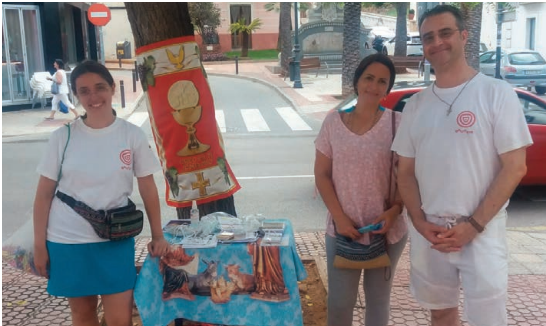
Evangelización en Benicasim (imagen superior) y Misión-Ebro, en Logroño y Zaragoza (imagen inferior).