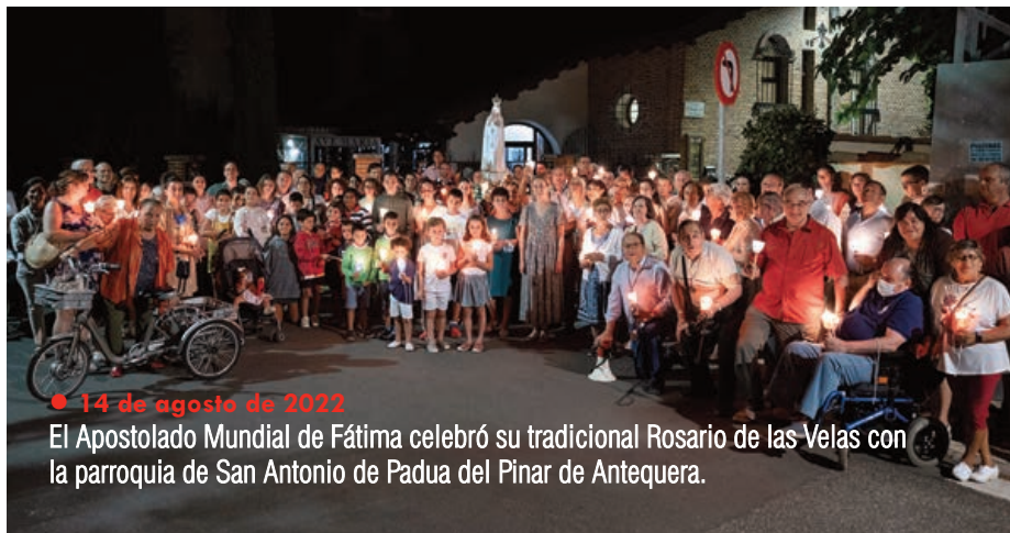
● 14 de agosto de 2022 El Apostolado Mundial de Fátima celebró su tradicional Rosario de las Velas con la parroquia de San Antonio de Padua del Pinar de Antequera.