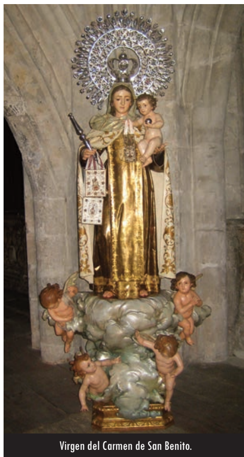
Virgen del Carmen de San Benito.

El lugar que ocupa hoy el retablo mayor de la iglesia de San Benito, hasta la desamortización y sus consecuencias, estuvo ocupado por el gran retablo que Alonso Berruguete había realizado relatando la vida de santo fundador, por indicación y encargo de los monjes negros. Tras los acontecimientos del siglo XIX, la restauración del culto de este templo estuvo impulsada por los terciarios carmelitas, establecidos anteriormente en el convento de frailes calzados edificado junto al Campo Grande. Allí realizaban su fiesta mayor como era costumbre cada 16 de julio, mientras que los descalzos la efectuaban en la octava de Pentecostés. La mencionada desamortización también afectó a los citados terciarios. Ellos se establecieron después en la parroquia de San Lorenzo, con una devoción cada vez más creciente que se llevaron consigo a aquel gran templo de San Benito cuando se convirtieron en sus propietarios. Ellos disponían de una imagen muy venerada de la Virgen del Carmen