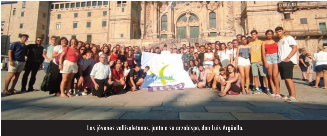
Los jóvenes vallisoletanos, junto a su arzobispo, don Luis Argüello.