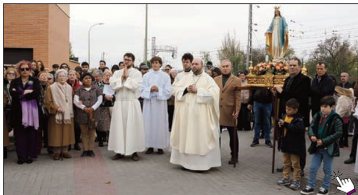
Procesión en honor a la Virgen Milagrosa en Viana de Cega, coincidiendo con Cristo Rey

Cuentan las crónicas que el 25 de noviembre de 1.939 un polvorín que había sido instalado en Viana de Cega durante la Guerra Civil comenzó a arder. La Guerra había concluido, pero en su interior permanecían aún los artefactos militares. Temerosos de una onda expansiva que, en caso de explosión, podría arrasar con todo a varios kilómetros a la redonda, muchos vecinos emprendieron la huida. Otros se quedaron tratando de sofocar las llamas. Todos temían lo peor. Hasta que entrado ya el 26 de noviembre, fecha en la que estaba previsto que el pueblo celebrara la festividad de la Virgen de la Medalla Milagrosa, el viento cambió de dirección, facilitando, así, la extinción del incendio. Al regresar a sus casas los vecinos calificaron lo ocurrido de “milagro” y la