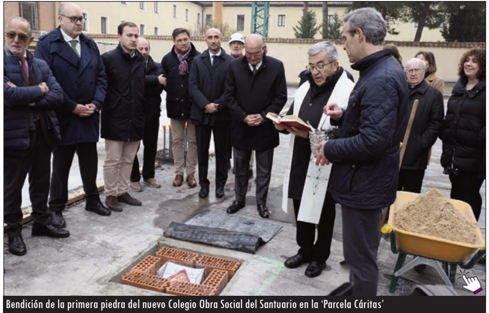
Bendición de la primera piedra del nuevo Colegio Obra Social del Santuario en la 'Parcela Cáritas'

El nuevo edificio contará con una superficie construida de 1.700 metros cuadrados, distribuidos en planta baja y primera planta. Estará do-