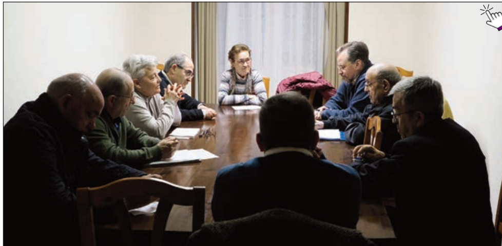
El 14 de noviembre se celebró un encuentro con agentes de caridad y pastoral social con motivo de la VIII Jornada Mundial de los Pobres convocada por el Papa Francisco para el 17 de noviembre de 2024

E l Santuario Nacional de La Gran Promesa fue inaugurado en el año 1941 y el 12 de mayo de 1964 el Papa Pablo VI concedió al templo el título de Basílica menor. El Centro Diocesano de Espiritualidad (CDE) se constituyó el 28 de septiembre de 1994 como un lugar de acogida, descanso, oración y formación, donde encontrarse con Dios, con uno mismo, con los demás. Ambos son lugares de paz en el corazón de Valladolid.