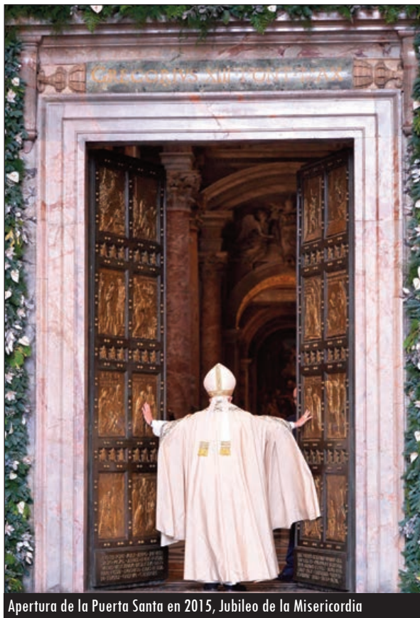
Apertura de la Puerta Santa en 2015, Jubileo de la Misericordia

Adviento, abrámonos al que viene, preparemos el camino al Señor. ¡Ven, Señor Jesús!