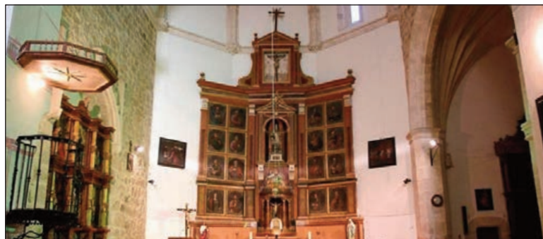
Interior de la Iglesia Parroquial San Martín de Tours

En el interior, el retablo mayor data del primer cuarto del siglo XVII.