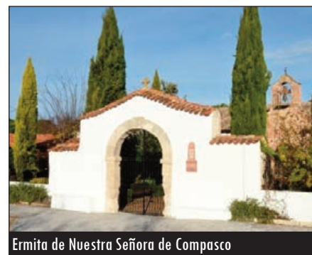
Ermita de Nuestra Señora de Compasco

También San Roque, patrón del municipio, a quien se celebra cada 16 de agosto con una procesión, cuenta con su propia Ermita. Pese a no conocerse una fecha clara sobre su construcción, empleando el adobe como material fundamental, dice la voz popular que "lleva toda la vida aquí, pues ni los abuelos ni los más viejos del lugar recuerdan haberla visto levantar". En su interior se encuentra la restaurada talla de San Roque, Santo Patrón de las Fiestas de Aldeamayor de San Martín.