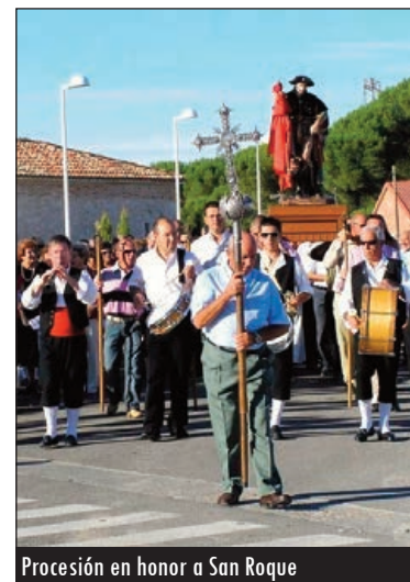
Procesión en honor a San Roque

Fue reformado en la época neoclásica con pinturas de la época, conservando los 16 lienzos del apostolado. También son destacables el retablo renacentista atribuido a la escuela de Alonso Berruguete; el retablo de Santa Catalina; y la cabeza de San Juan Bautista (1.545), obra