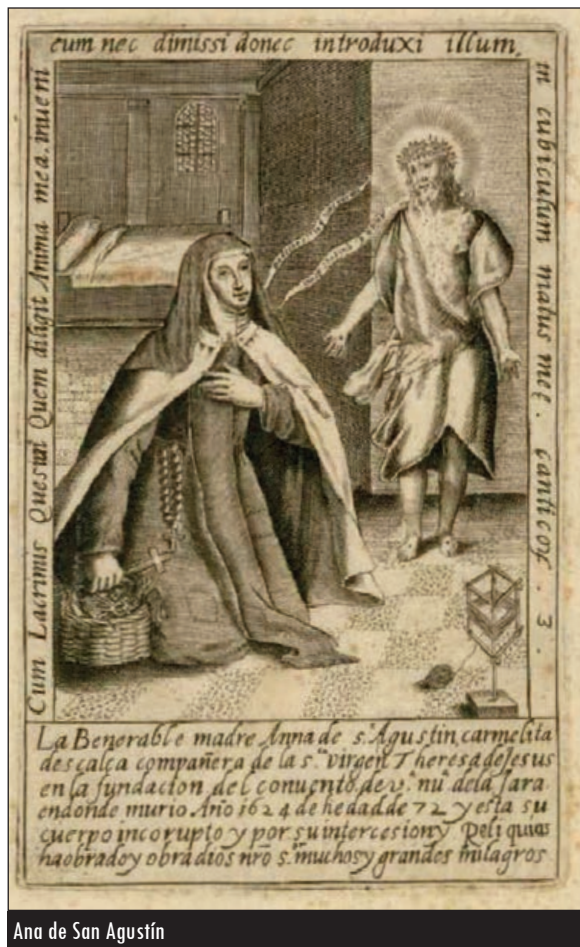
Ana de San Agustín

En ese momento fue derribada y trasladada al antiguo templo de los jesuitas que se encontraba anteriormente bajo la advocación de San Ignacio de Loyola, hasta la expulsión de la