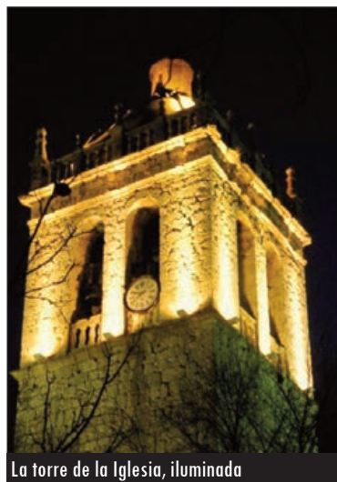
La torre de la Iglesia, iluminada