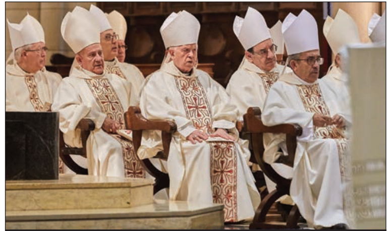
El Arzobispo de Valladolid, junto a otros prelados en la Catedral de La Almodena

Este tipo de campañas solidarias y de sensibilización con donativos en especie que se celebran en los colegios en otras épocas del año, como las fechas previas a la Navidad, tienen un “fuerte” componente educativo para los alumnos, según señalan desde la Delegación de Enseñanza de la Archidiócesis de Valladolid. El resultado, seis carros de la compra que viajaron hasta Valencia; y otros