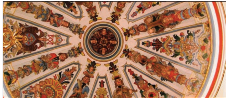
Yeserías de la Capilla-Camarín de la Virgen del Carmen, en la Iglesia de Santiago Apóstol