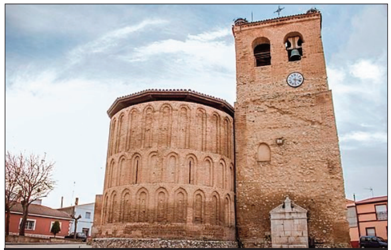
Iglesia de San Pedro Apóstol

Pedro Apóstol, del siglo XIII e igualmente de estilo románico-mudéjar, es hermosa por disponer de un ábside y una torre magníficos. Con el paso del tiempo se fue deteriorando hasta el punto de que estuvo declarada en ruinas, por lo que también tuvo que cerrarse al culto. Pos-