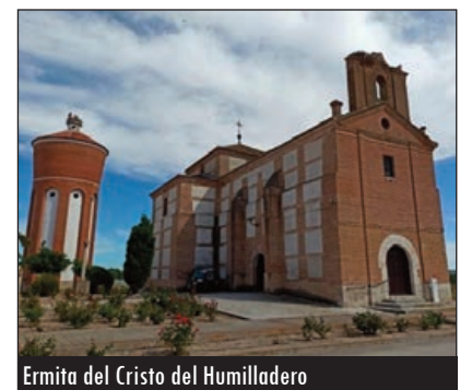
Ermita del Cristo del Humilladero