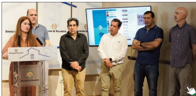
Rueda de prensa de presentación en la Diputación Provincial de Valladolid