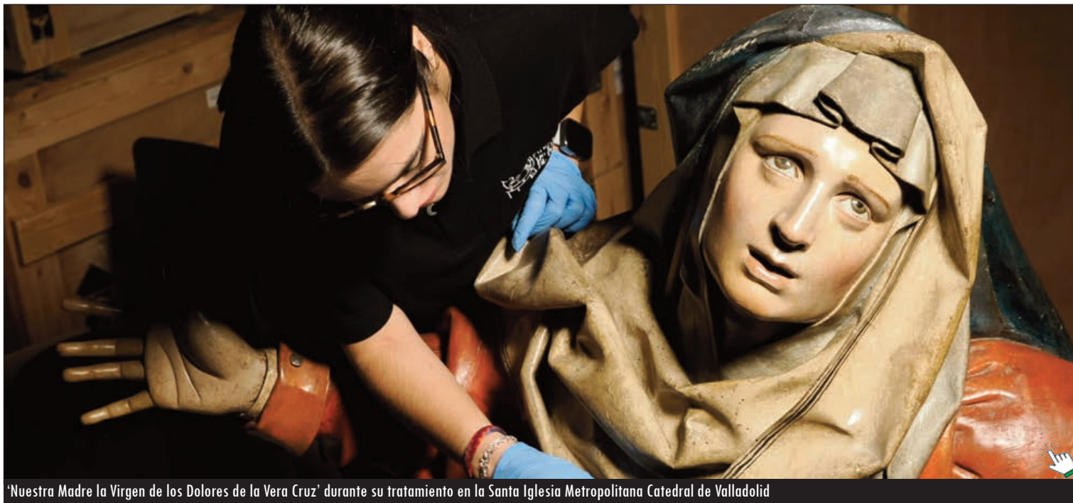
'Nuestra Madre la Virgen de los Dolores de la Vera Cruz' durante su tratamiento en la Santa Iglesia Metropolitana Catedral de Valladolid

La Archidiócesis ha habilitado San Miguel para mantener el culto a la Dolorosa, entre otras imágenes, y al 'Lignum Crucis'