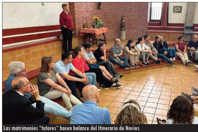
Los matrimonios "tutores" hacen balance del Itinerario de Novios

Para algunos este Itinerario, que se "afianza", ha servido de "primer anuncio", afirma Gordo. A otros, en cambio, les ha servido para "afianzar" su Fe, acercándose a otros sacramentos, como la Eucaristía.