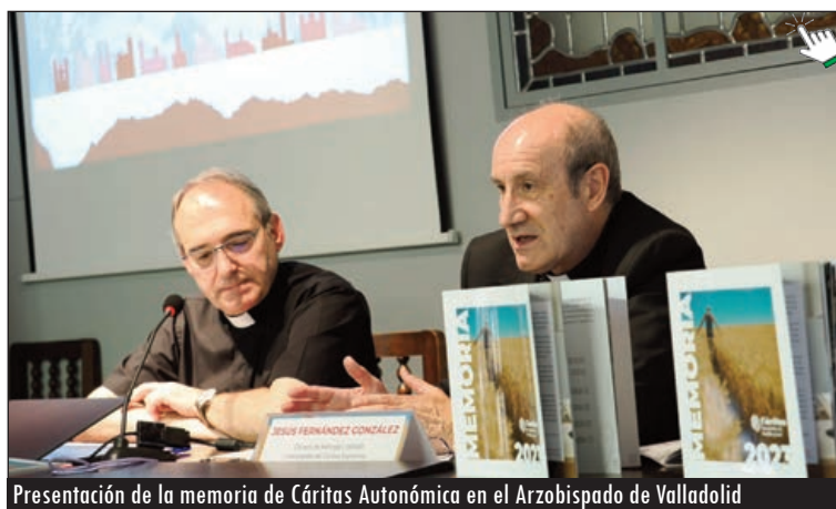
Presentación de la memoria de Cáritas Autónoma en el Arzobispado de Valladolid

La vivienda es otro de los "desafíos significativos" que afrontó Cáritas "ya que afecta a muchas familias" y "en diversos grados de vulnerabilidad. Como también lo es la salud mental. En este punto alertaron del "preocupante incremento" de situaciones de exclusión social ligadas a problemas de salud mental, por lo que abogaron por atenderla de una manera "integral" y "reconociendo