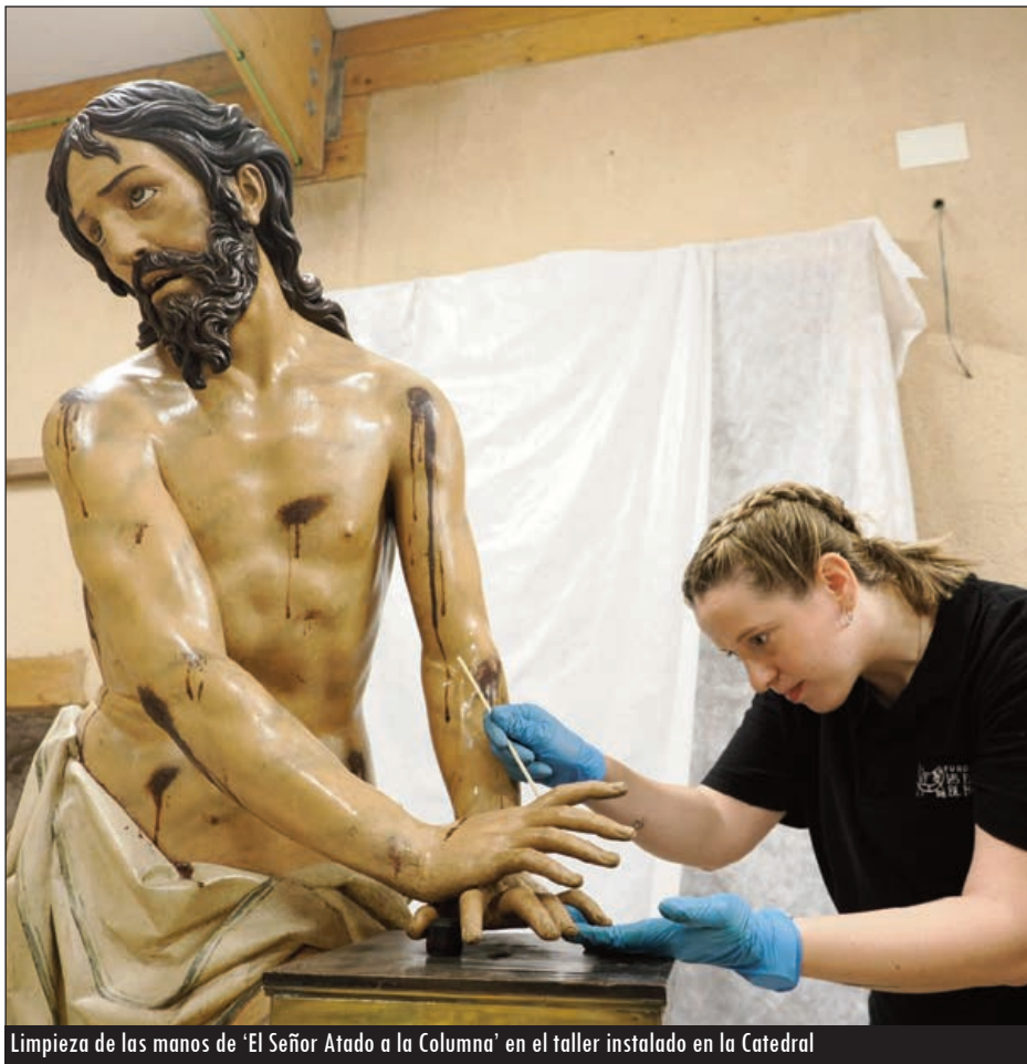
Limpieza de las manos de 'El Señor Atado a la Columna' en el taller instalado en la Catedral

mentación fotográfica exhaustiva" de todas estas piezas a las que se retira el polvo "con paletinas de pelo suave y aspiradores", tanto de mano como eléctricos. Una tarea en la que se afanan los técnicos ataviados con guantes y un bastoncillo con algodón en uno de sus extremos, lo que les permite llegar hasta el fondo de los pliegues que los imagineros tallaron en la madera policromada para dar movimiento a sus vestiduras o al cabello.