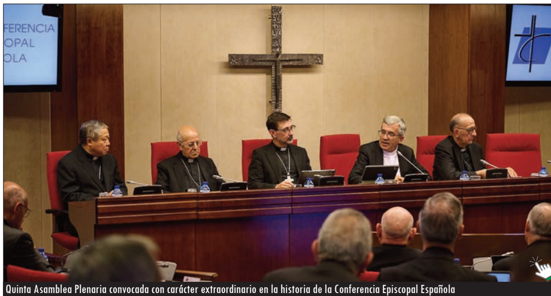
Quinta Asamblea Plenaria convocada con carácter extraordinario en la historia de la Conferencia Episcopal Española

Los obispos de la CEE estuvieron acompañados en esta Asamblea Plenaria por representantes de la Conferencia Española de Religiosos (CONFER).