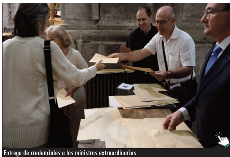
Entrega de credenciales a los ministros extraordinarios

Esta catequista y voluntaria de dos residencias de mayores, donde llevaba tiempo encargándose de la Celebración Litúrgica de la Palabra,