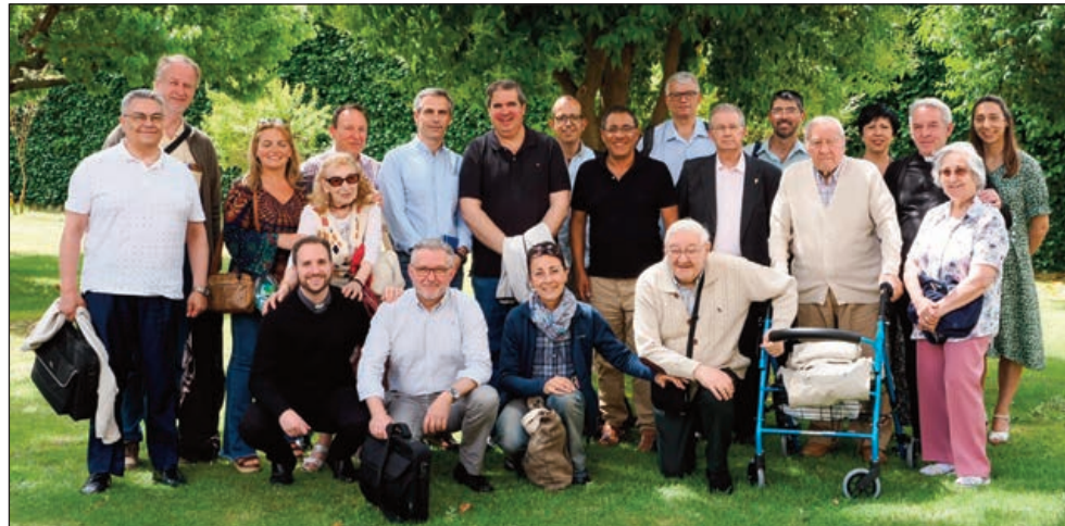
Diáconos permanentes de las diócesis de Castilla y León celebraron el pasado 22 de junio un encuentro con otros aspirantes, esposas y presbíteros. Fue un día de convivencia, formación y oración

E l Santuario Nacional de La Gran Promesa fue inaugurado en el año 1941 y el 12 de mayo de 1964 el Papa Pablo VI concedió al templo el título de Basílica menor. El Centro Diocesano de Espiritualidad (CDE) se constituyó el 28 de septiembre de 1994 como un lugar de acogida, descanso, oración y formación, donde encontrarse con Dios, con uno mismo, con los demás. Ambos son lugares de paz en el corazón de Valladolid.