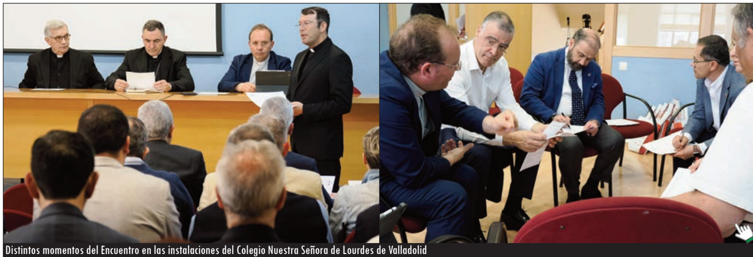
Distintos momentos del Encuentro en las instalaciones del Colegio Nuestra Señora de Lourdes de Valladolid