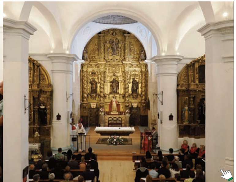
Eucaristía por la festividad de San Pedro Apóstol (izda.) y detalles de las columnas y bóvedas de la Iglesia de San Pedro de Villalón de Campos tras su restauración (dcha.)