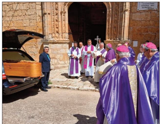
Llegada del féretro a la Iglesia de Nuestra Señora de Tovar

Exhortó, entonces, el arzobispo de Valladolid a "ser agradecidos". Porque "ser hijos", prosiguió, "es ser humildes y salir al paso de la ciega pretensión de autonomía del mundo moderno".