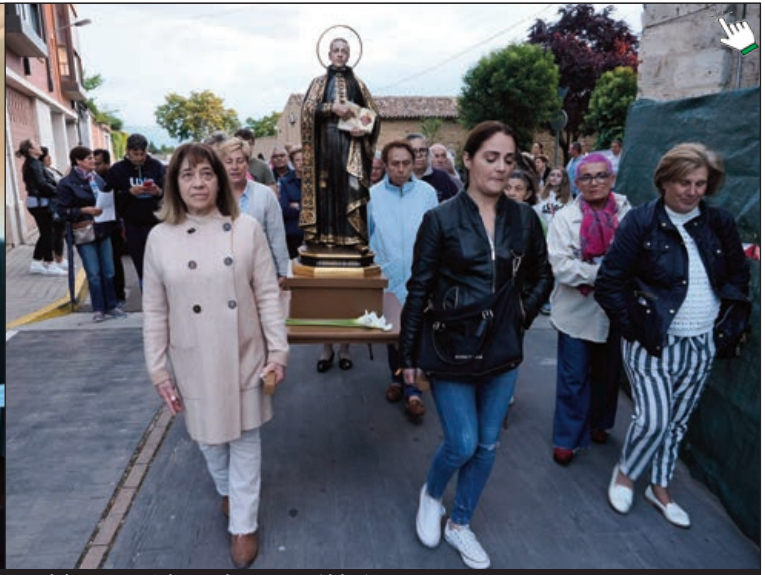
Asamblea de la Asociación Padre Hoyos en Torrelobatón (izda.) y Procesión con la imagen peregrina del Beato en Cabezón de Pisuerga (dcha.)