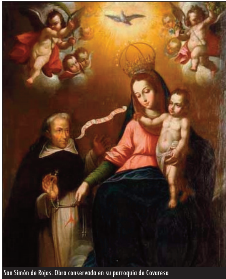
San Simón de Rojas. Obra conservada en su parroquia de Covaresa