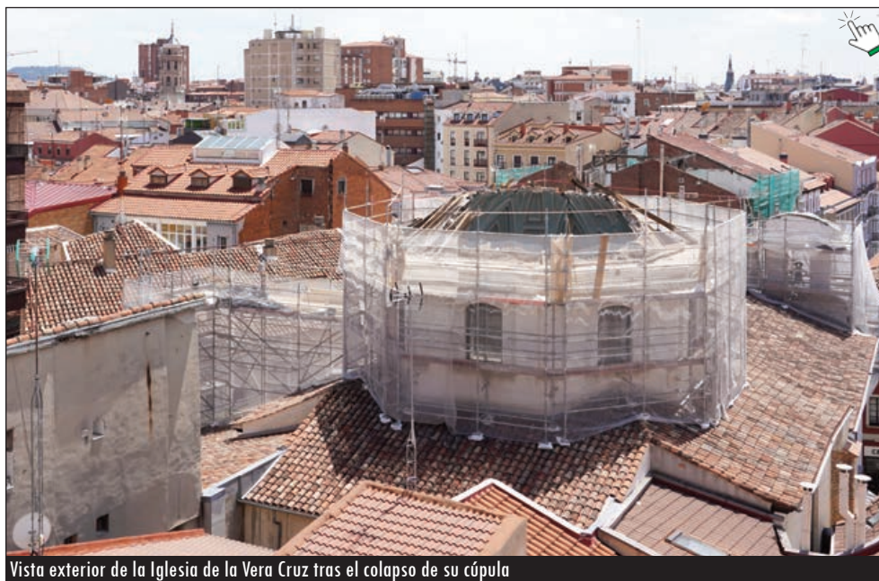
Vista exterior de la Iglesia de la Vera Cruz tras el colapso de su cúpula