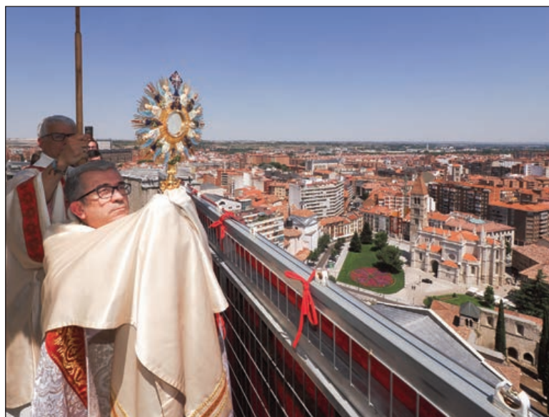
Primer centenario de la entronización del Corazón de Jesús en la Catedral (Junio, 2023)

Por primera vez, además, la Basílica—Santuario Nacional de la Gran Promesa recibió con motivo del Año Jubilar del Corazón de Jesús a un