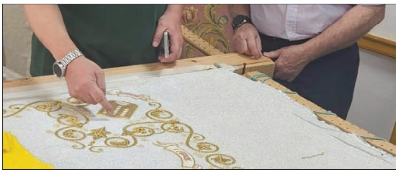
Trabajos realizados hasta junio en el nuevo manto por el centenario de la Virgen de la Soterraña