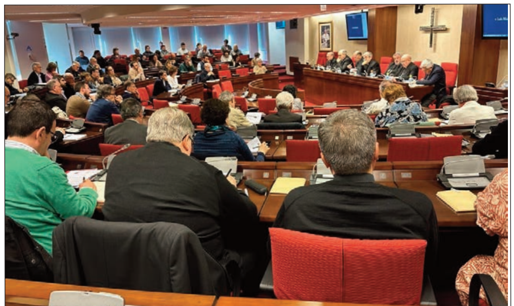
Asamblea sinodal de la Conferencia Episcopal Española celebrada el pasado 4 de mayo en la Conferencia Episcopal Española.

Para poder trabajar mejor con corresponsabilidad se recogen algunas propuestas de órganos y ministerios que, o bien existen ya, pero deben renovarse, o bien deben crearse: los Consejos Pastorales y Económicos, que supongan una representación amplia de la vida de la Iglesia o de la comunidad tanto en sus miembros como en los temas que se traten, que sean deliberativos y exista una interconexión entre diversos Consejos; la institución de los ministerios laicales, la creación del ministerio de la acogida, la escucha y el acompañamiento; implantar