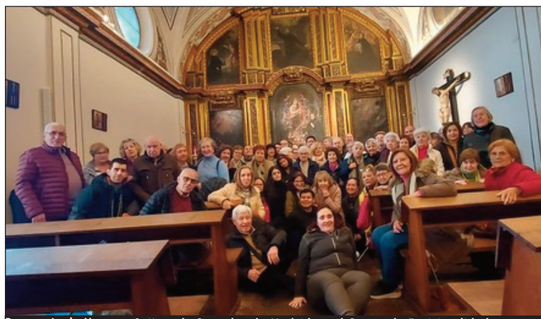
Parroquia de Nuestra Señora de Sonsoles de Madrid en el Centro de Espiritualidad.