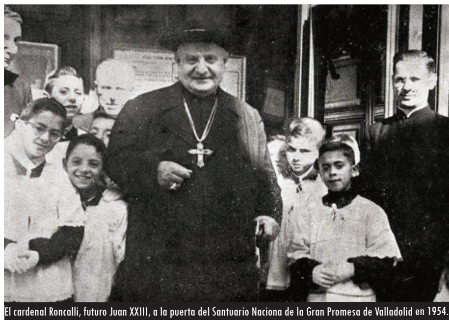
El cardenal Roncalli, futuro Juan XXIII, a la puerta del Santuario Nacional de la Gran Promesa de Valladolid en 1954.