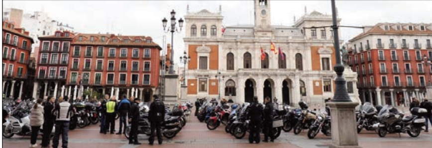
Jubileo de los moteros en la Catedral y en el momento de las inscripciones en la Plaza Mayor.