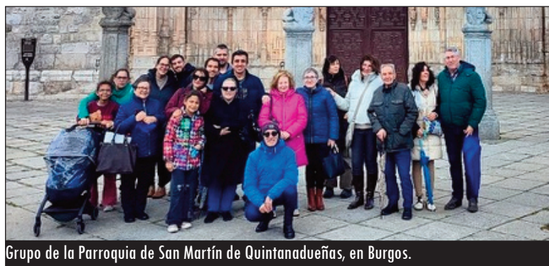
Grupo de la Parroquia de San Martín de Quintanadueñas, en Burgos.

Otras parroquias procedentes de otras ciudades, como la Parroquia de S. José Obrero (de Móstoles), Parroquia Virgen de la Paloma y la de Nuestra Señora de Son-