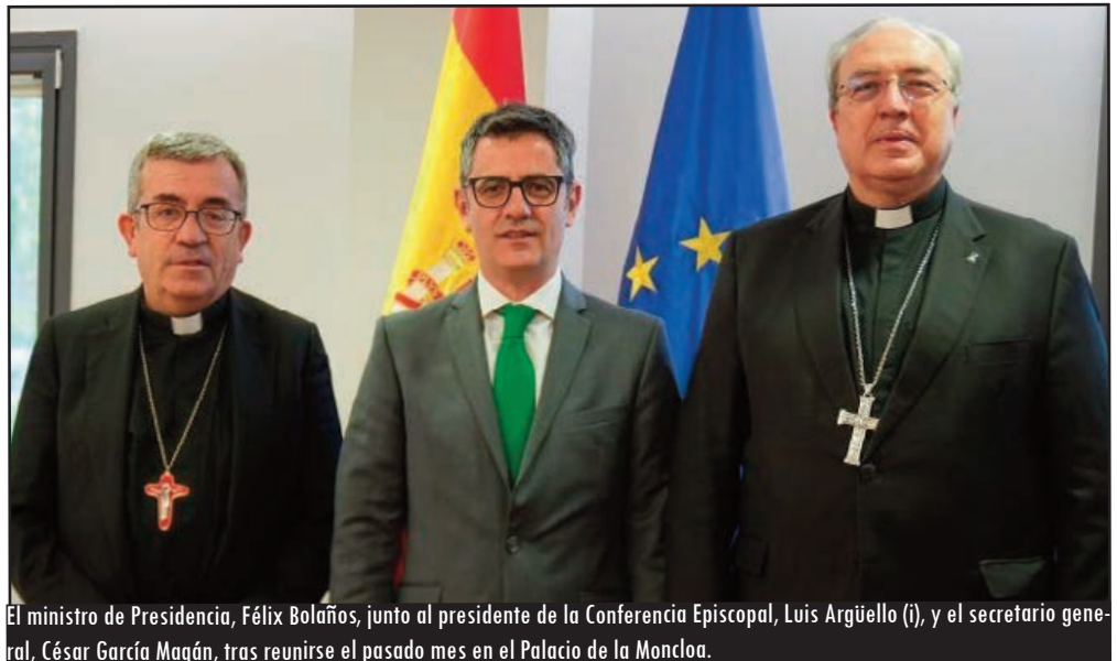
El ministro de Presidencia, Félix Bolaños, junto al presidente de la Conferencia Episcopal, Luis Argüello (i), y el secretario general, César García Magán, tras reunirse el pasado mes en el Palacio de la Moncloa.

"No se pueden plantear medidas de reparación que, siguiendo el informe del Defensor del Pueblo, dejarían fuera a 9 de cada 10 víctimas. La Iglesia no puede aceptar un plan que discrimina a la mayoría de las víctimas de abusos sexuales" ha asegurado el portavoz de la Conferencia Episcopal Española (CEE), César García Magán. "Están haciendo un análisis parcial y oculta un problema social de enormes dimensiones", apuntaron las mismas fuentes para subrayar que el documento está hecho "sin ningún tipo de garantía jurídica".