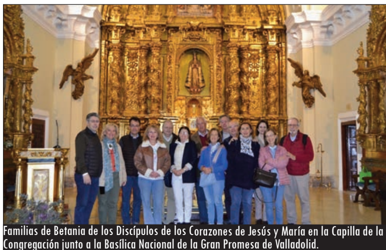
Familias de Betania de los Discípulos de los Corazones de Jesús y María en la Capilla de la Congregación junto a la Basílica Nacional de la Gran Promesa de Valladolid.