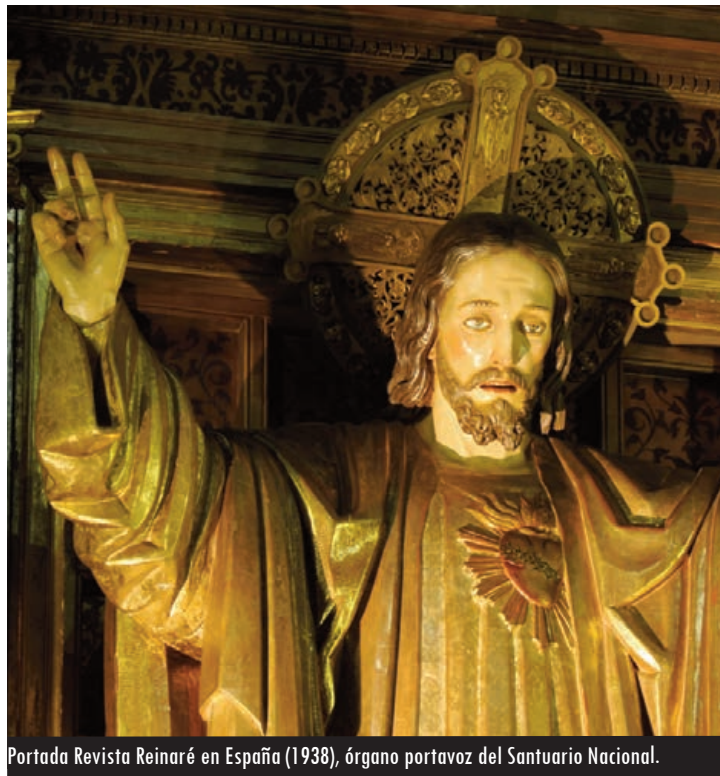
Portada Revista Reinaré en España (1938), órgano portavoz del Santuario Nacional.

Los primeros pasos del Santuario Nacional se mezclaron muy fácilmente con la extraña, controvertida y trágica situación de España en los meses de 1936. Las elecciones generales supusieron un intento de movilización de la derecha católica contra las fuerzas, mucho mejor cohesionadas, de la izquierda. Tras la victoria de esta última no fue extraño que en la fiesta del Sagrado Corazón de Jesús de 1936, el arzobispo Gandásegui afirmase que este Santuario Nacional era el “más alto simbólico altar de la Patria y de la Raza, cuya pronta dedicación será una piedra miliaria”. Las semanas posteriores al golpe de estado del 18 de julio fueron de desconocimiento del paradero del prelado pues se hallaba en aquellos momentos en la Clínica San Ignacio de San Sebastián. El clima bélico en el Valladolid de retaguardia, como indica el profesor Palomares Ibáñez, mezclaba conceptos: “Reinaré en España”, Sagrado Corazón, “¡Viva Cristo Rey!” o Santuario