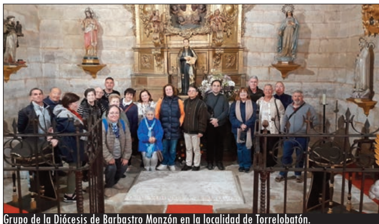
Grupo de la Diócesis de Barbastro Monzón en la localidad de Torrelobatón.

Y esta Año Jubilar espera las visitas de cualquier persona que quiera acercarse al Corazón de Jesús a través de la Gran Promesa del padre de Torrelobatón. Una experiencia única como están describiendo numerosos grupos de personas de aquí y de allí que se están adentrando estos meses en la realidad única que habita en el Corazón de Castilla y, más en concreto, en esta Basílica de la Gran Promesa que afronta sus últimas semanas de visitas extraordinarias aunque permanece para siempre abierta para todos. • Magnolia Felipe Gil