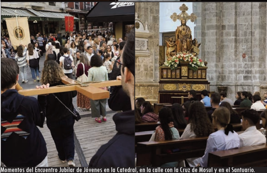
Momentos del Encuentro Jubilar de Jóvenes en la Catedral, en la calle con la Cruz de Mosul y en el Santuario.