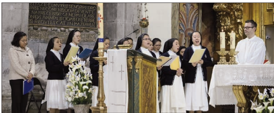
Celebración de la Jornada de Oración por las Vocaciones y por las Vocaciones Nativas en la Iglesia de Santa Clara.