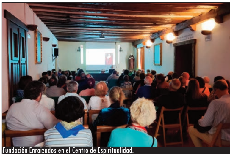
Fundación Enraizados en el Centro de Espiritualidad.