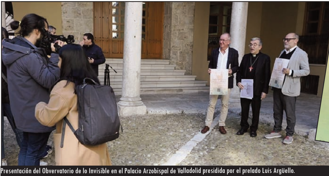
Presentación del Observatorio de lo Invisible en el Palacio Arzobispal de Valladolid presidida por el prelado Luis Argüello.

La Fundación Vía del Arte traslada de Guadalupe en Cáceres a la Santa Espina durante una semana de julio la propuesta donde más de un centenar de estudiantes vivirán una experiencia inmersiva en esta escuela de arte y espiritualidad