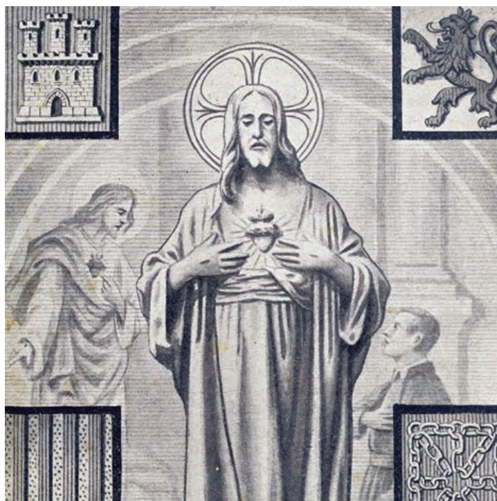
Portada Revista Reinaré en España (1938), órgano portavoz del Santuario Nacional.

La situación cambiante que se produjo desde abril de 1931 impidió su celebración pero el arzobispo Gandásegui continuó trabajando de cara a la celebración del segundo centenario de la Gran Promesa, que habría de ser en mayo de 1933. Esto suponía avanzar en la transformación