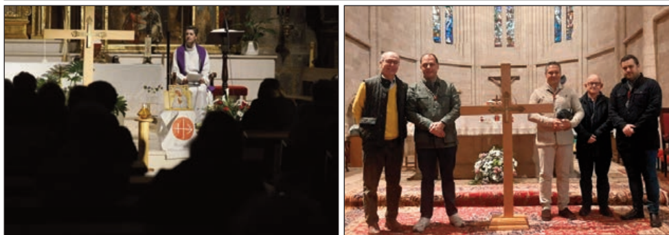
Cruz de Mosul en el Seminario, en la Parroquia de la Asunción de Laguna y en la Cofradía de la Precios

El año Jubilar del Corazón de Jesús trae a la Diócesis de Valladolid como fruto del compromiso de un grupo de laicos que forman la nueva delegación de la fundación pontificia Ayuda a la Iglesia Necesitada (ACN) en Valladolid. Siguiendo el deseo del arzobispo se quieren llevar a cabo actividades periódicas para orar, difundir el conocimiento de ACN y sensibilizar sobre la realidad de los cristianos perseguidos en el mundo y apoyarles.