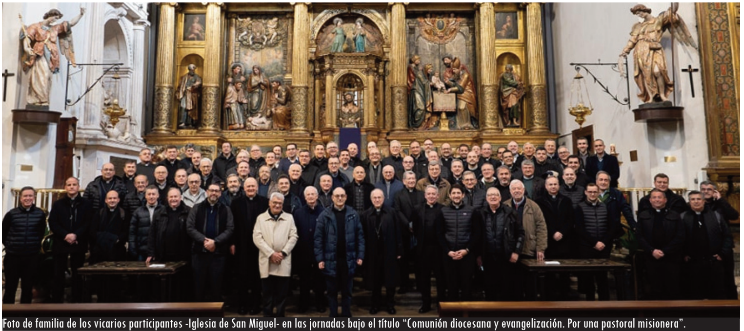
Foto de familia de los vicarios participantes -Iglesia de San Miguel- en las jornadas bajo el título “Comunión diocesana y evangelización. Por una pastoral misionera”.