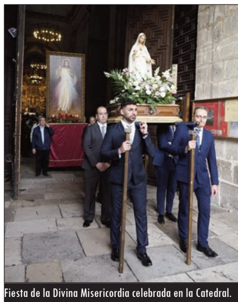
Fiesta de la Divina Misericordia celebrada en la Catedral.