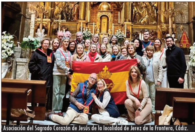
Asociación del Sagrado Corazón de Jesús de la localidad de Jerez de la Frontera, Cádiz.