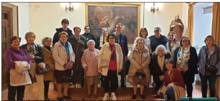
Grupo de la Parroquia de Santa María, de Cabezón de Pisuerga