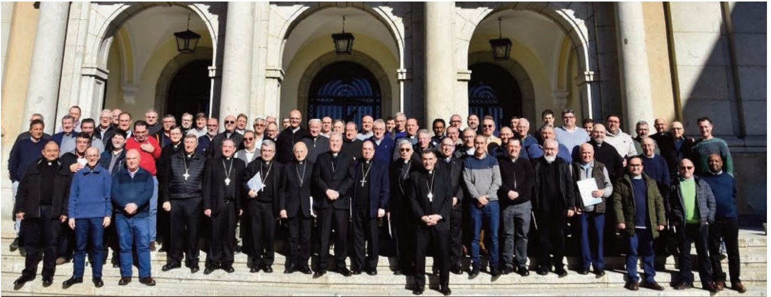
Encuentro de obispos, vicarios y arciprestes de Iglesia en Castilla congregó en Ávila a un centenar de personas provenientes de las nueve diócesis de la demarcación.

Monseñor Argüello determina que “la Iglesia está llamada a anunciar la Palabra, celebrar la Liturgia y testimoniar la caridad acogiendo la novedad del signo del tiempo. No podemos pretender que las cosas cambien si hacemos siempre lo mismo”