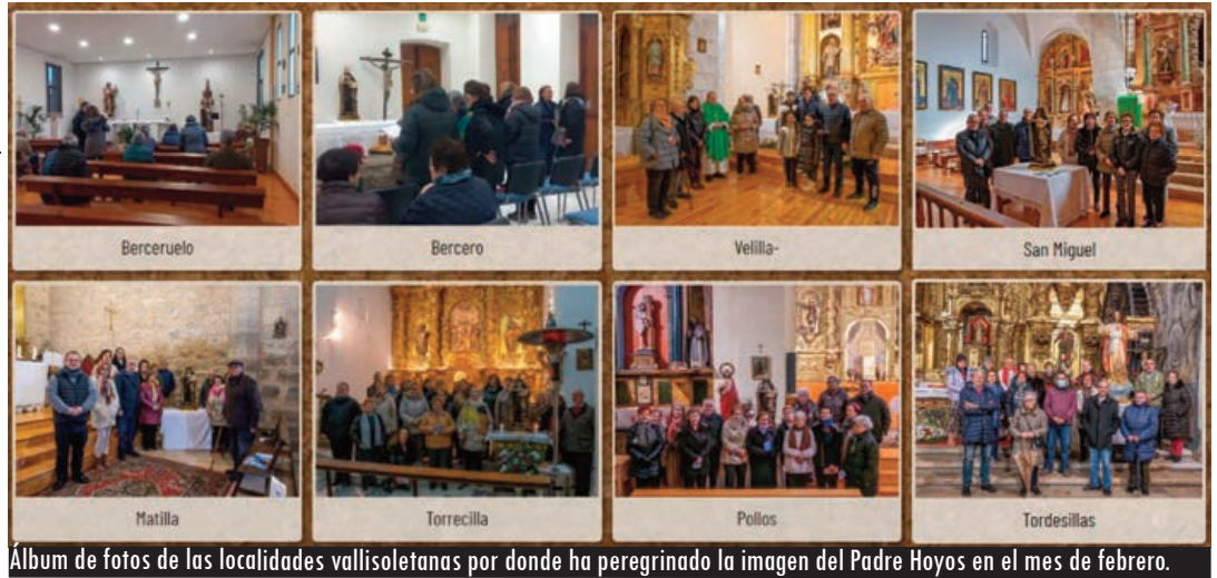
Álbum de fotos de las localidades vallisoletanas por donde ha peregrinado la imagen del Padre Hoyos en el mes de febrero.

Muchos municipios de la provincia de Valladolid reciben la imagen del beato ante la extendida devoción al Sagrado Corazón de Jesús