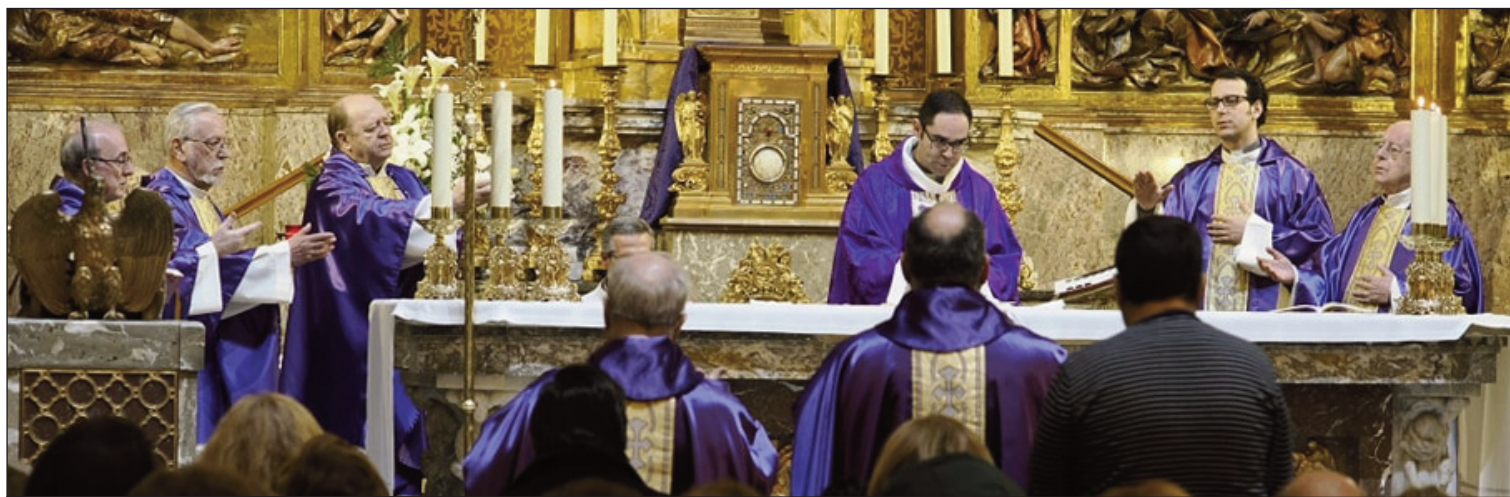
Celebración eucarística en la Basílica del Santuario Nacional de la Gran Promesa en el cuatrocientos aniversario de la muerte del jesuita vallisoletano Luis de la Puente.