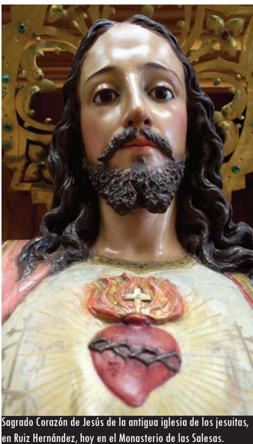
Sagrado Corazón de Jesús de la antigua iglesia de los jesuitas, en Ruiz Hernández, hoy en el Monasterio de las Salesas.