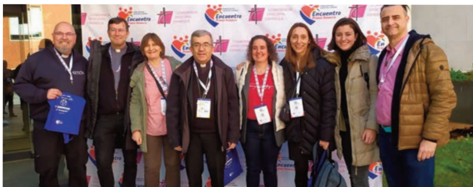
La Diócesis de Valladolid ha celebrado su I Encuentro sobre El Primer Anuncio en el Seminario.