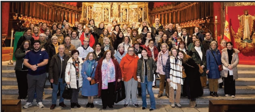
En la festividad de su patrón, San Enrique de Ossó, más de un centenar de catequistas vivieron su Jubileo en este Año Jubilar del Corazón de Jesús en una jornada de encuentro, oración y formación en la que compartieron la alegría de este ministerio que educa en la fe. El arzobispo de Valladolid, Luis Argüello, les acompañó en la Santa Iglesia Catedral para celebrar la eucaristía y templo donde pudieron ver la exposición 'Venega tu Reino'.

E l Santuario Nacional de La Gran Promesa (SNGP) fue inaugurado en 1941 y, el 12 de mayo de 1964, el papa Pablo VI concedió al templo el título de basílica menor. El Centro Diocesano de Espiritualidad (CDE) nació el 28 de septiembre de 1994 como un lugar de acogida, descanso, oración y formación, donde encontrarse con Dios, con uno mismo o con los demás. Ambos edificios son lugares de paz, en pleno corazón de Valladolid.