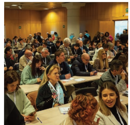
Delegación vallisoletana participante en el Congreso 'Iglesia en la educación' en el recinto ferial de Madrid.

tres desafíos elegidos al final de la mañana en cada ámbito. Las intervenciones de los panelistas se introdujeron con bellos espectáculos de danza y música alusivos a cada realidad eclesial.