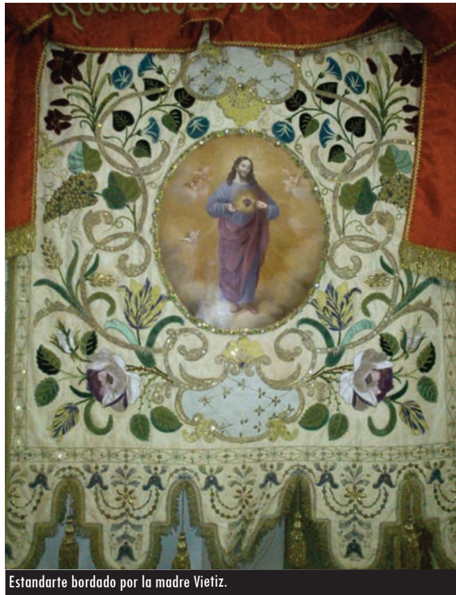
Estandarte bordado por la madre Vieitiz.

Los años que permanecieron en aquel caserón de las comendadoras de Santiago es uno de los episodios más singulares de la vida religiosa en Valladolid. Inicialmente, vivieron en compañía de la última de ellas, Dominica Sisniega, que se terminó trasladando a otro de su orden. Las monjas de la Visitación estaban preocupadas que aquel edificio “amplio y situado en el centro de la población”, fuese el adecuado para establecer un pensionado para la formación de las niñas que les fuesen encomendadas y de las cuales también podían surgir las pertinentes vocaciones para la vida religiosa. La madre superiora consagró todo el monasterio al Sagrado Corazón realizando una procesión interior. En 1864 celebraron la beatificación de aquella monja salesa de Paray-le-Monial, Margarita María de Alacoque, tan importante en la trayectoria de la devoción pública del Sagrado Corazón. Quizás fue la primera gran fiesta hacia el exterior que convocaron en Valladolid como relatan sus crónicas. Era