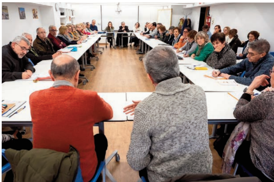
El Seminario acogió las primeras reuniones diocesanas para ver las realidades de la Iglesia en Valladolid.