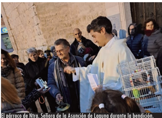
El párroco de Ntra. Señora de la Asunción de Laguna durante la bendición.

La Iglesia de Valladolid celebró la fiesta de san Antonio Abad siendo la Parroquia del Santísimo Salvador el epicentro de las bendiciones en la capital donde en la homilía se recordaron algunas de las virtudes de san Antonio, eremita que vivió 105 años y fue el fundador del monacato.