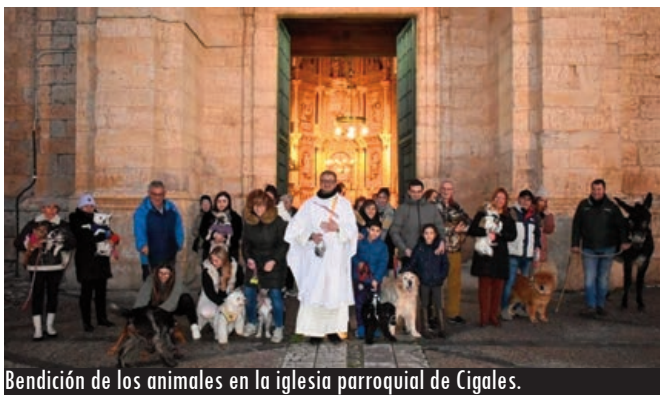
Bendición de los animales en la iglesia parroquial de Cigales.

Valladolid, Laguna de Duero, Cigales... El patrón de los animales bendice por capital y provincia a las mascotas de muchos ciudadanos y también a los que a su vez protegen a las ganaderías