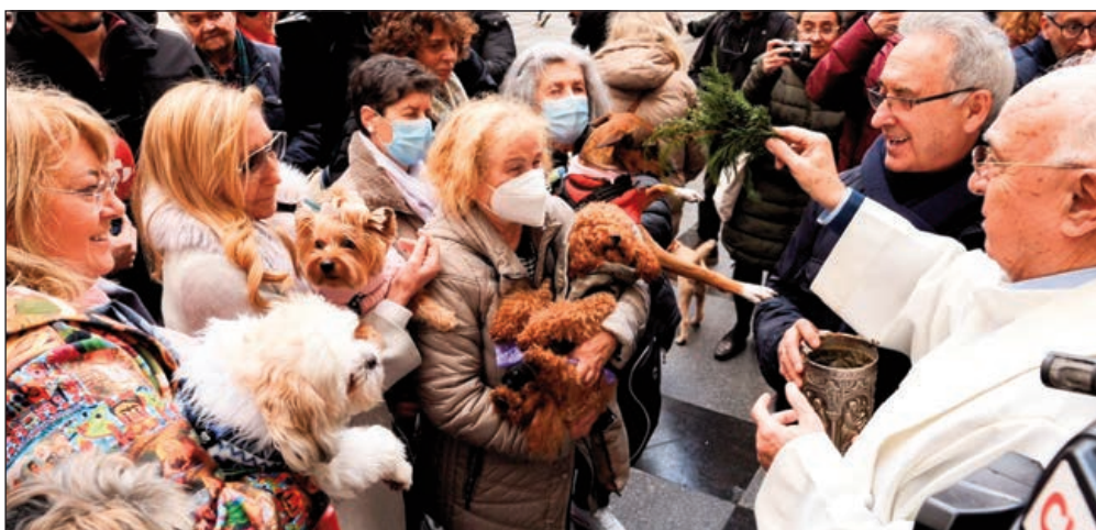
Bendición de los animales el día de San Antón a las puertas de la iglesia parroquial del Salvador de Valladolid.