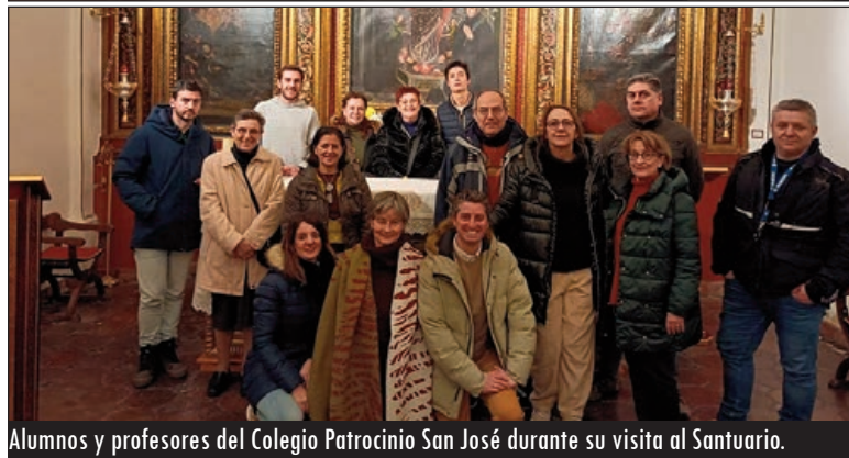
Alumnos y profesores del Colegio Patrocinio San José durante su visita al Santuario.

quia, nos ha traído a los jóvenes que se preparan a la confirmación junto con sus catequistas de las parroquias de Nuestra Señora de la Asunción y de San Pedro Regalado, ambas de Laguna. La