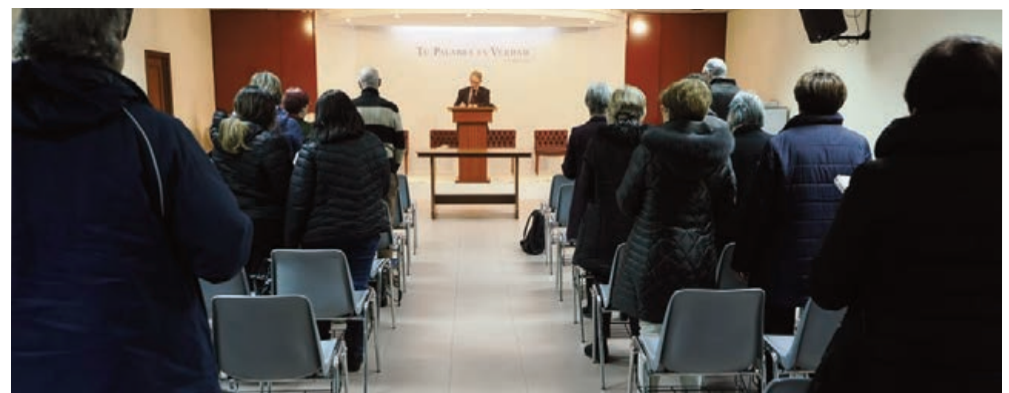
Celebraciones de la Semana de Oración por la Unidad de los Cristianos con representantes de todas las confesiones.

internacional de oración, conformando así, según explica la Subcomisión, lo que Paul Couturier llamó un «vasto monasterio invisible» donde todos elevan al unísono la petición del Señor: «Padre, que todos sean uno para que el mundo crea» (Jn 17,21).