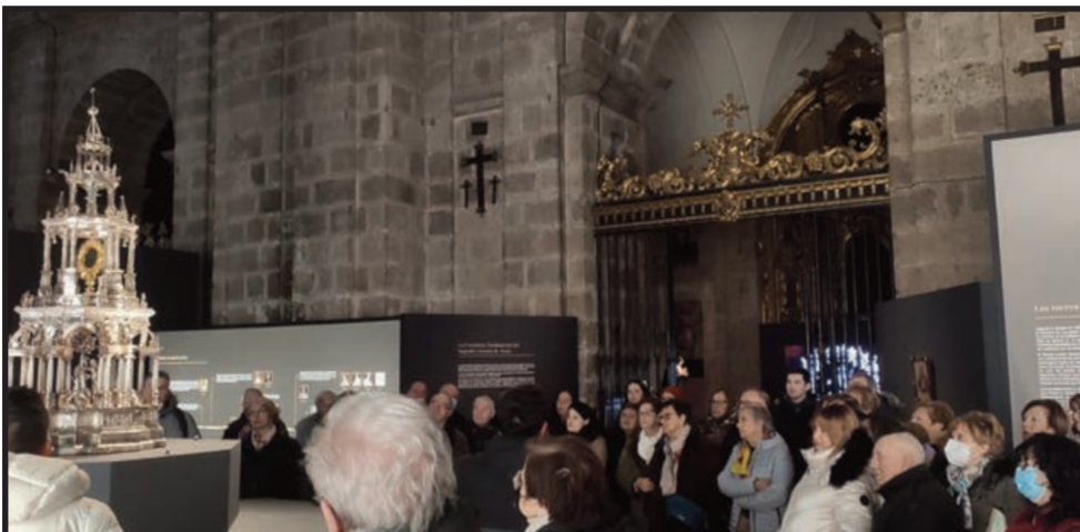
Algunas de las parroquias que forman el Arciprestazgo de Pinares celebraron el Año Jubilar con una visita a la exposición "Venga Tu Reino" en la Catedral y posteriormente celebraron la Eucaristía grupal en el Santuario.

E l Santuario Nacional de La Gran Promesa (SNGP) fue inaugurado en 1941 y, el 12 de mayo de 1964, el papa Pablo VI concedió al templo el título de basílica menor. El Centro Diocesano de Espiritualidad (CDE) nació el 28 de septiembre de 1994 como un lugar de acogida, descanso, oración y formación, donde encontrarse con Dios, con uno mismo o con los demás. Ambos edificios son lugares de paz, en pleno corazón de Valladolid.