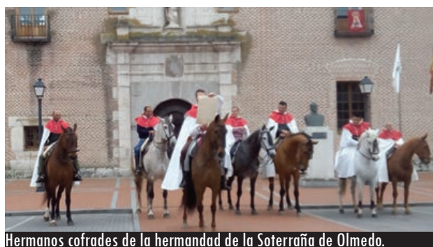
Hermanos cofrades de la hermandad de la Soterraña de Olmedo.

La Cofradía de la Soterraña de Olmedo convoca siete plazas de 'Heraldos de la Virgen'. Dentro de los preparativos del Centenario de la Coronación, la Cofradía de la Soterraña ha creado la sección de los heraldos, abierta a siete caballistas que sean hermanos de la misma. Los siete primeros cofrades en apuntarse tendrán la misión de salir a caballo por las calles de Olmedo convocando a los vecinos con motivo de las fiestas de la Soterraña. Este grupo se registrará por un reglamento aprobado recientemente.