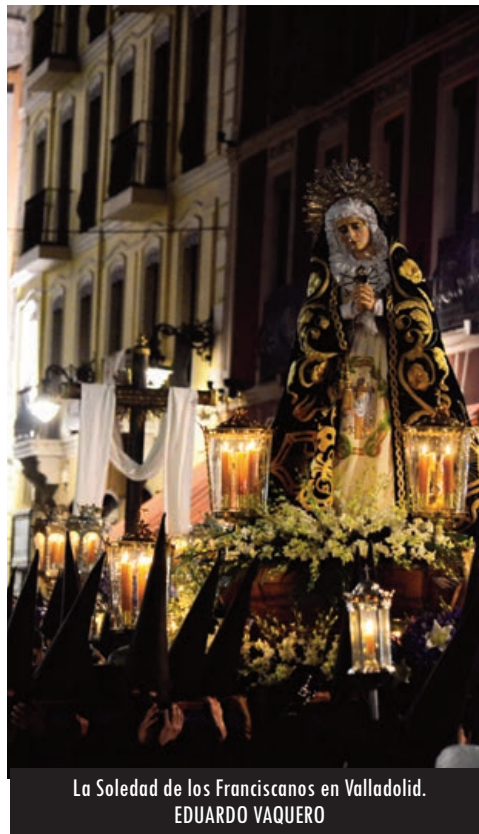
La Soledad de los Franciscanos en Valladolid.