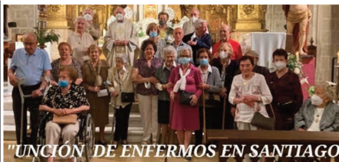
"UNCIÓN DE ENFERMOS EN SANTIAGO"

La parroquia de Santiago de Valladolid aprovechó la Pascua del Enfermo para administrar a los fieles el sacramento de la Unción de Enfermos.