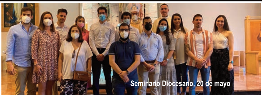
Seminario Diocesano, 20 de mayo