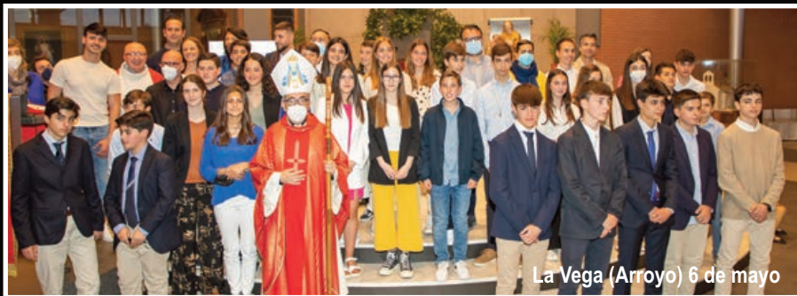
La Vega (Arroyo) 6 de mayo