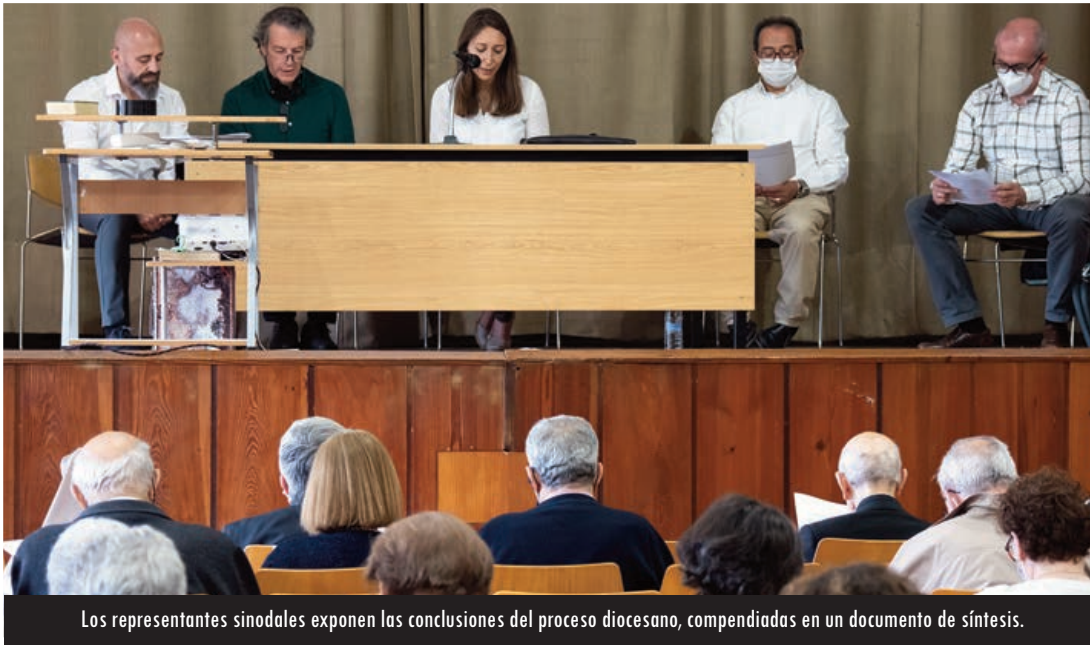
Los representantes sinodales exponen las conclusiones del proceso diocesano, compendiadas en un documento de síntesis.