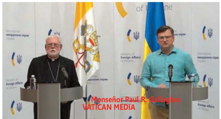
Monseñor Paul R. Gallagher

Últimamente ha viajado a Kiev Monseñor Paul R. Gallagher, el “ministro” de Asuntos Exteriores de la Santa Sede, que se ha entrevistado con su colega Kubela y ha visitado algunas de las fosas comunes donde yacen centenares de cadáveres sin identidad conocida. “No es lo mismo – ha dicho – ver la guerra por televisión que tocarla en la realidad”. Y ha advertido del peligro de que lleguemos a cansarnos y hastiarnos de ese espectáculo sanginario olvidándonos de que arrebatada la vida a hermanos y hermanas nuestras, niños inocentes y ancianos incluidos.