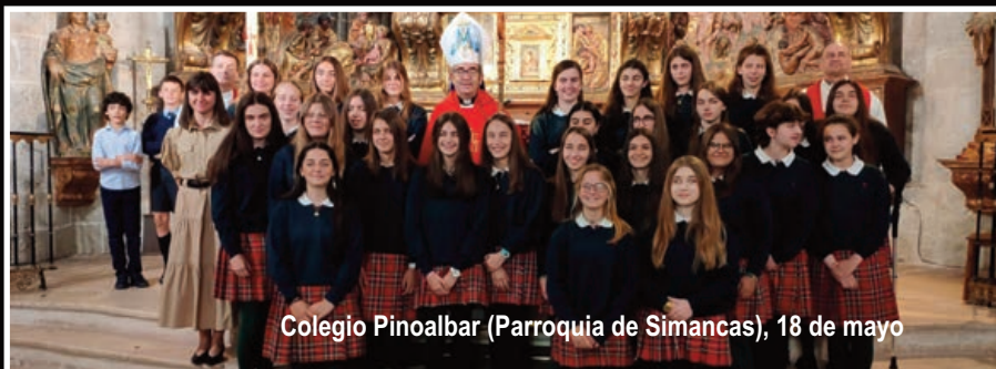
Colegio Pinoalbar (Parroquia de Simancas), 18 de mayo