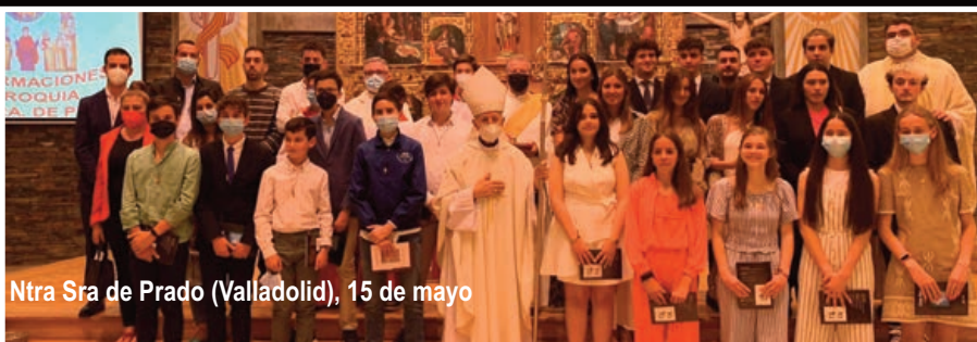
Ntra Sra de Prado (Valladolid), 15 de mayo