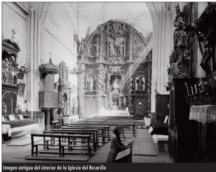
Imagen antigua del interior de la Iglesia del Rosarillo

Tenemos que partir de dos cofradías que nacieron por separados en sendos ámbitos de la ciudad del siglo XV y XVI, la del Rosario