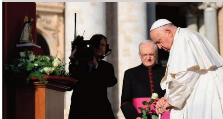
El Papa, rezando ante una imagen de la Virgen de los Desamparados, patrona de Valencia

Cuando aflore el “miedo” a “ser reprendidos por Dios”, recomendó el Santo Padre: “Pónganse en oración”. Pero en una oración “con el corazón y no con los labios”. “No sean como loros”, clamó el Papa Francisco, que aprovechó para recordar que “Dios perdona primero”.