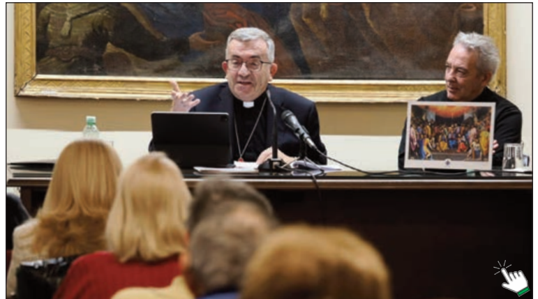
El Arzobispo, junto al icono regalado por el Papa Francisco a los padres sinodales

Sin obviar las “resistencias” y “cansancios” que se vivieron, incluso, en el aula sinodal pese a la petición del Papa Francisco de apartar agendas ideológicas propias que “no todo el mundo escuchó”, lamentó monseñor Argüello, el texto supone un “impulso” a la “acogida plena” del Concilio Vaticano II y “como magisterio ordinario” del Santo Padre, que no documento normativo como aclaró el prelado vallisoletano, apela a “todas las iglesias” a continuar “su camino cotidiano con una metodología sinodal de consulta y de discernimiento”. Esto último, con la necesidad de “conjugar” la relación entre la Iglesia particular y universal. “Algo que se dice faci-