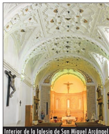
Interior de la Iglesia de San Miguel Arcángel