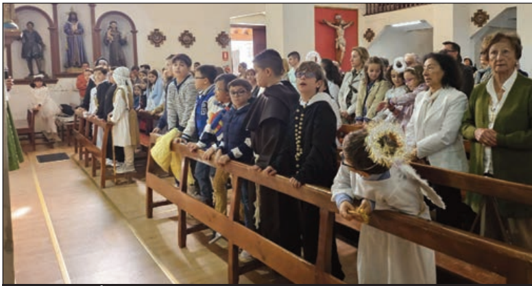
Niños y niñas de Íscar disfrazados de santos para celebrar 'Holywins'