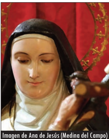
Imagen de Ana de Jesús (Medina del Campo)

Por primera vez la Iglesia celebra la fiesta de la beata Ana de Jesús, coincidiendo con la fecha de su nacimiento el 25 de noviembre