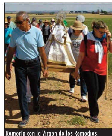
Romería con la Virgen de los Remedios

Por otra parte, los templos, especialmente los de estilo románico, no solían ser en general de grandes dimensiones.