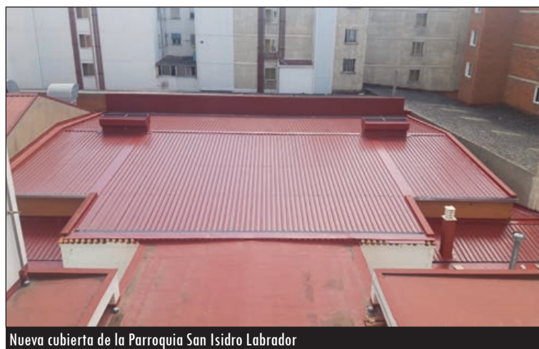
Nueva cubierta de la Parroquia San Isidro Labrador