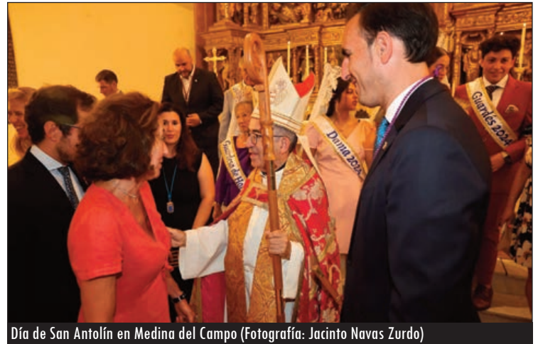
Día de San Antolín en Medina del Campo

R: Don Luis nos ha insistido mucho en que construyamos parroquias misioneras y apostólicas, que no demos por supuesta la Fe por el mero hecho de ser hijos de ese pueblo. Ha invitado a la corresponsabilidad apostólica, a recuperar la vocación bautismal y no esperar todo del sacerdote. Les ha invitado a los pueblos más pequeños a ser generosos en la comprensión de la parroquia como un ámbito más amplio que los límites de su población. Que del mismo modo que se desplazan a otros pueblos para ciertos servicios, como la compra, el banco,