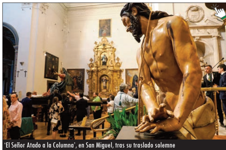
'El Señor Atado a la Columna', en San Miguel, tras su traslado solemne

Por su parte, el proyecto de reconstrucción de la cúpula de la Vera Cruz continúa a buen ritmo. En julio se celebraron una ponencia y comisión extraordinarias de la Comisión de Patrimonio de la Junta de Castilla y León, que dio en agosto su visto bueno al planteamiento inicial.