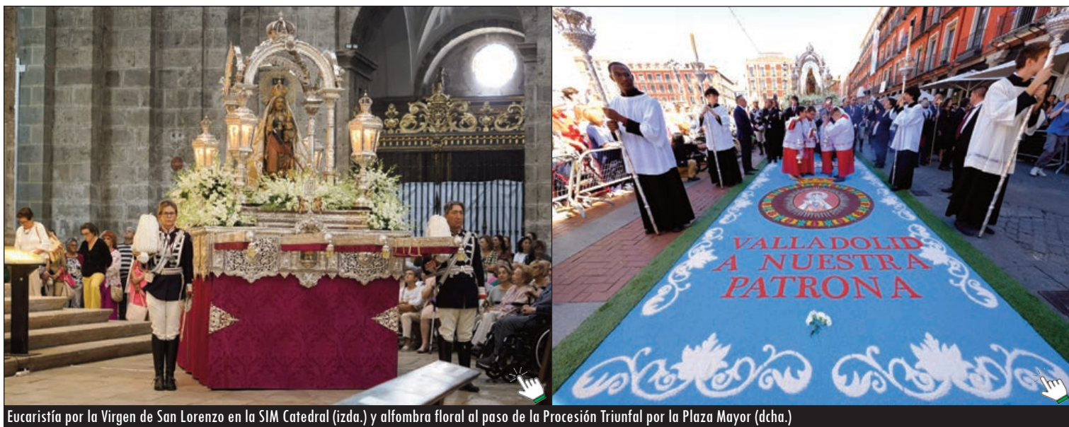
Eucaristía por la Virgen de San Lorenzo en la SIM Catedral (izda.) y alfombra floral al paso de la Procesión Triunfal por la Plaza Mayor (dcha.)

Como cada 8 de septiembre miles de personas llenaron las calles de la capital en la festividad de la Natividad de la Virgen, que este año, además, se celebró en domingo