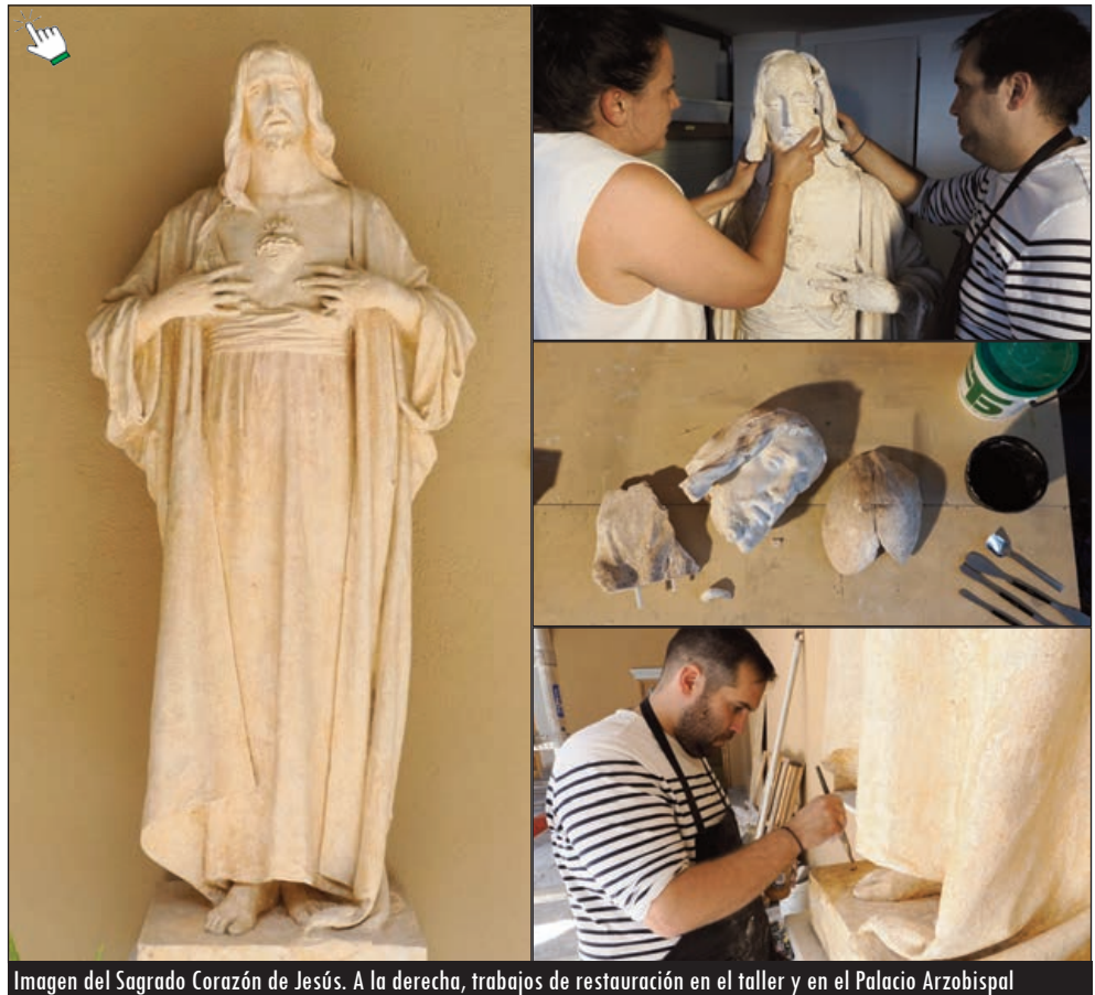
Imagen del Sagrado Corazón de Jesús. A la derecha, trabajos de restauración en el taller y en el Palacio Arzobispal

Hasta fechas recientes este Sagrado Corazón de Jesús había permanecido expuesto en el patio interior del citado inmueble, donde Ramón Núñez (1868-1937) instaló su casa-taller en Valladolid. En ese período de tiempo la obra