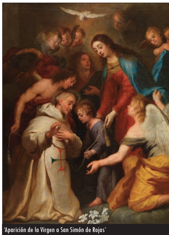
'Aparición de la Virgen a San Simón de Rojas'

Unos pocos años habrían de tardarse para solicitar los nuevos planos de la futura construcción definitiva e inacabada de la que, al principio, continuaba siendo colegiata y después catedral con la creación de la Diócesis, precisamente un 25 de septiembre de 1595. Los planos los habría de entregar el arquitecto más importante para la Monarquía, Juan de Herrera, que venía